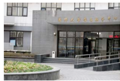
募金活動が行われた学生サービスセンター

3月11日の午後、地震のニュースを聞いた時、本当に驚きました。津波に飲み込まれた町、おもちやのように海に浮かんでいる自動車、そういう画面を見たとき、私は悲しい涙を流しました。「すぐに相手の安全を知りたくて、メールを送りました」「相手の安全を一刻も早く確認したい」と思って、国際電話もかけて見ましたが、通じませんでした」と2年生の学生から聞きました。