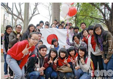
〈日本を応援するハノイの大学生達〉

ちょうど、アジア風新聞春号の編集にとりかかる時期だったので、今号は「東日本大震災特集」にすることに決め、Iメイト会員に「震災関連のメールを転送してほしい」と依頼したところ、10日間に合計20名のIメイト会員から転送メールが届いた。一生懸命に気持ちを伝えるという学生たちのメール文は、どれも捨てたいけれど