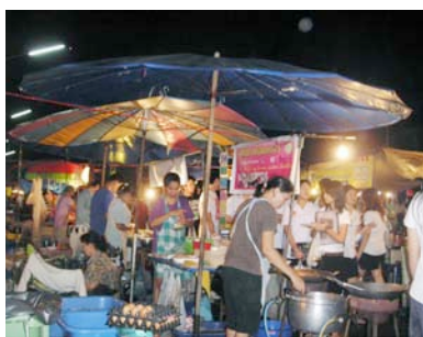
キャンパス内の市場の様子

期末試験の採点をしていた時、一人の学生から電話があり「日本で震度9の大きい地震があった。津波が心配です。先生のご家族は大丈夫?」とのこと。驚きのあまりとっさには事態が理解できず、すぐに日本人講師室に向かい同僚に知らせると、皆一斉に日本の家族に連絡を取り始めました。