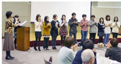
〈インタビューに答える留学生〉