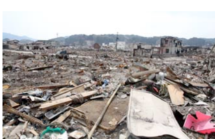
〈津波後の火災で焼け野原と化した岩手県山田町市街地〉

けたらいいか、みなさんのお知恵を借りたい。地震、津波に引きつづいた放射能の事故は、「対岸の火事」という格言が死語になるような実感を全人類につきつけ、地球が「運命共同体」に乗せた船であることを連想させた。火元である日本は、世界中の支援と励ましに応えるために、復旧、復興にも、よいお手本を示さなければならぬ。