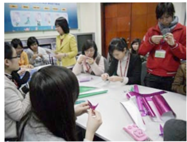
千羽鶴を折る学生たち

大地震発生翌日十二日は、私が主宰する勉強会の日だった。「先生ご家族は？」心配そうな顔で全員が私を見ている。「大丈夫でした」。拍手歓声が起こった。「イメイトの〇〇さんも大丈夫でした。嬉しいです」。「今日メールします」。相手の顔を思い浮かべて心配している学生に胸が熱くなった。顔が見えるイメイト交流が根付いてきていることを実感した。学部の先生から電話がかかってきた。「外国のニュースがトップに流れることはないのです。大丈夫ですか?」。コーヒー店ではベトナム語で、大学事務室では英語で「家族は大丈夫?」と聞かれた。GAMAN強く分かち合いを忘れずにこの危機を乗り越えようとしている日本人の様子が伝えられているらしく、「日本人は偉いです」と秘書。記事に胸を打たれ募金したと学生。多くの人に声をかけられた。