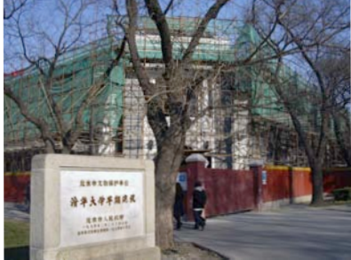
「清華学堂」のトタン

今年開学百周年を迎える名門大学で、ちょっとした「異変」がおきた。北京市文物局からおしかりを受けたのだ。「二校門」という白い門の前で記念写真をとった人も多いだろうが、この門をくぐると学生の宿舎だった「清華学堂」をはじめとする開学初期の建物がある。