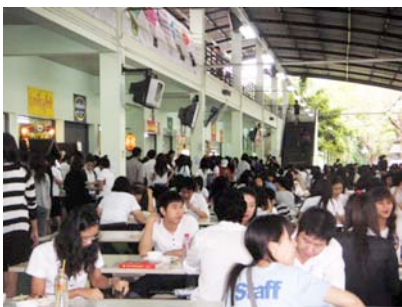
学生と職員でいっぱいの食堂の様子

こんにちは。今回は日本語学科がある教養学部棟から一番近い食堂の様子をお伝えします。一番近いといっても、歩いて7〜8分くらいの距離にあります。ここには、様々なタイ料理の店や飲み物の店などが8〜10軒入っています。ほとんどが注文を受けて、その場でご飯や麺類を調理して出す店です。1品の値段は約30パーツと格安です。日本料理のようなものを出す店もあり、かつ丼やカレーや鯖定食が食べられます。