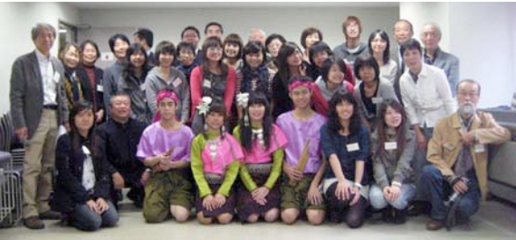
（参加者全員で記念撮影）