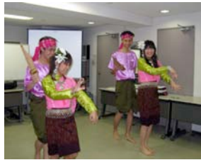
（民族舞踏を踊る留学生）

生たちが去った後、会員はグループに分かれIメイト交流について話し合いました。学生が学んでいる教科書を手として日本語支援に役立てたいという発案があり、その後Iメイト通信でお知らせしましたが、熱心なご指導には大変感謝を受けました。 なお、アジ風が所属する世田谷区世界交流プロジェクトから取材があり、1月29日(土)に世田谷区内で他のNPOともどもアジ風について、この時の写真や資料によって広報宣伝されます。社会貢献を考えている人たちから、入会者が増えたらうれしいですね。